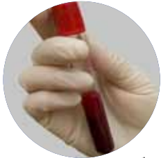
การตรวจเลือดหาเชื้อเอชไอวี