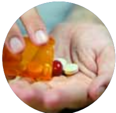
การรักษา