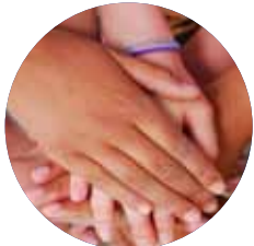
ผลการตรวจเลือด