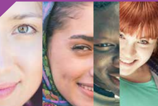
گزینه های جلوگیری از حاملگی