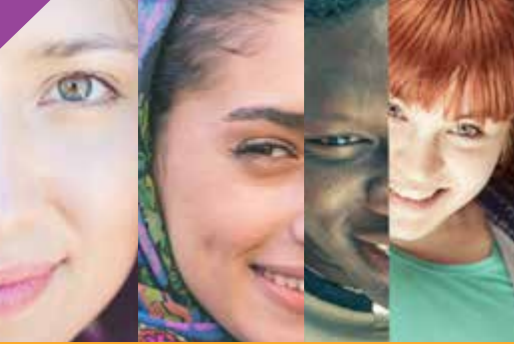
گزینه های جلوگیری کننده از بارداری