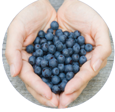
ការមើលថែទាំខ្លួនអ្នក

ប្រសិនបើលោកអ្នក ត្រូវការអ្នកបកប្រែ ដើម្បីនិយាយ ពីបញ្ហាកិច្ចបំរើទាំងនេះ សូមទាក់ទងកិច្ចបំរើបកប្រែ (Translating and Interpreting Service)