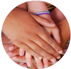
ការទំនាក់ទំនងរវាងមេរោគ HIV

មានកិច្ចបំរើឥតគិតថ្លៃជាច្រើនដែលលោកអ្នក អាច ទាក់ទង រកជំនួយ។ ទូរស័ព្ទទៅលេខ ដែលមាននៅលើក្រដាសនេះ ឬបើកមើលគេហទំព័រ។ កិច្ចបំរើទាំងអស់ រក្សាការសំងាត់។ ចូរមើលបញ្ជីរាយឈ្មោះ កិច្ចបំរើទាំងអស់ក្នុងរដ្ឋនេះ៖ www.positivelife.org.au/contacts