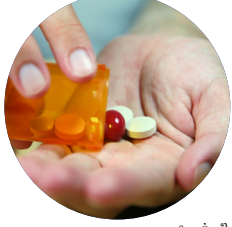
ការព្យាបាលផ្សេងៗ: ក្រដាសខាង ។

កិច្ចបំរើព្យាបាលជាច្រើន គឺឥតគិតថ្លៃទេ ប្រសិនលោកអ្នកមាន ប័ណ្ណ Medicare ។ នេះគេហៅថា "bulk billing"។ ប្រសិនបើលោកអ្នកគ្មានប័ណ្ណ Medicare ទេ ចូរទូរស័ព្ទទៅ កិច្ចបំរើសុខភាព ច្បាប់ដែលលិខិតជាងគេនៅតំបន់ អ្នកដើម្បីសួរថាតើគេអាចជួយអ្វីបានខ្លះ។