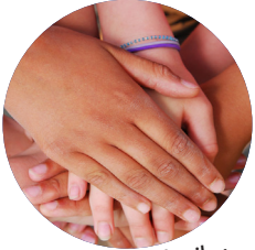
Utambuzi wa karibu

Wanawake na HIV: Vifurushi vya habari za mfululizo kwa wanawake