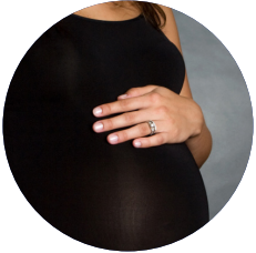
Ujazito na mimi