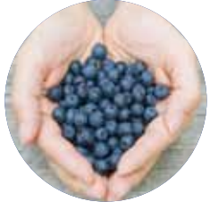
รักษาและใส่ใจสุขภาพตนเอง