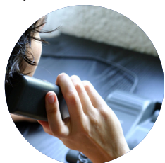
Các dịch vụ và các trang mạng của NSW