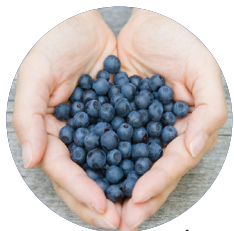
Chăm sóc bản thân