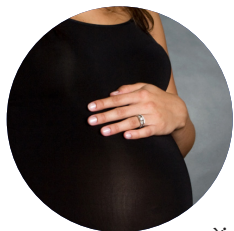
Việc mang thai và người mẹ